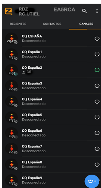
Red Digital Zello