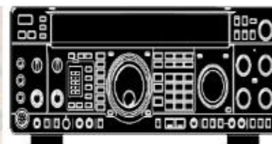
Equipo de Radio